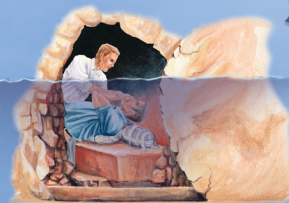
Sepultura en Agua