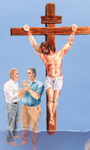
Muerte al Pecado